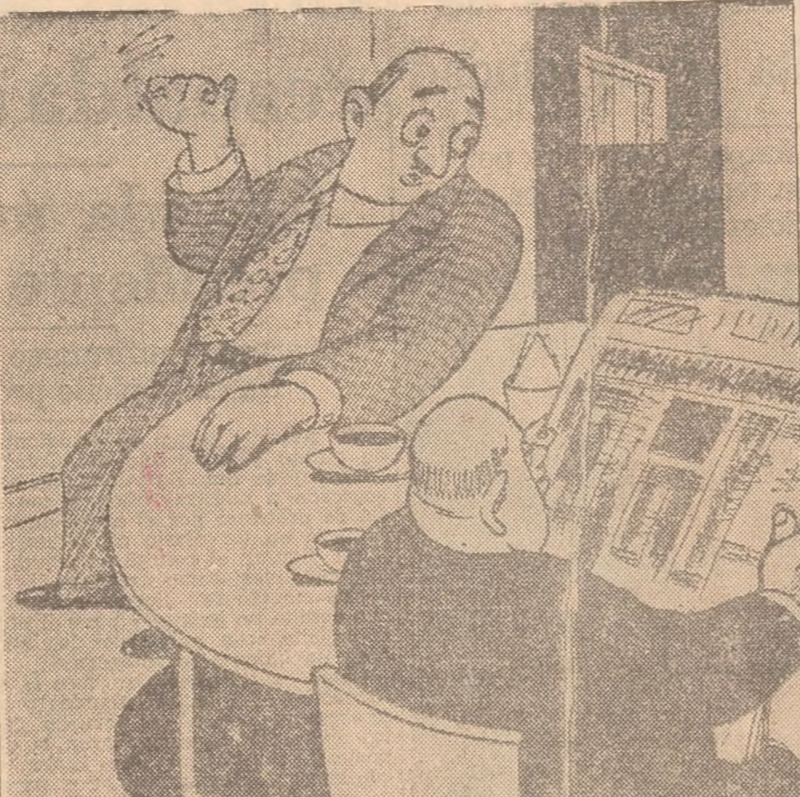
—La prensa liberal habla mucho ahora de la 'crisis conservadora'... —Y hace muy bien. Eso le sirve para olvidarse de su propia crisis...